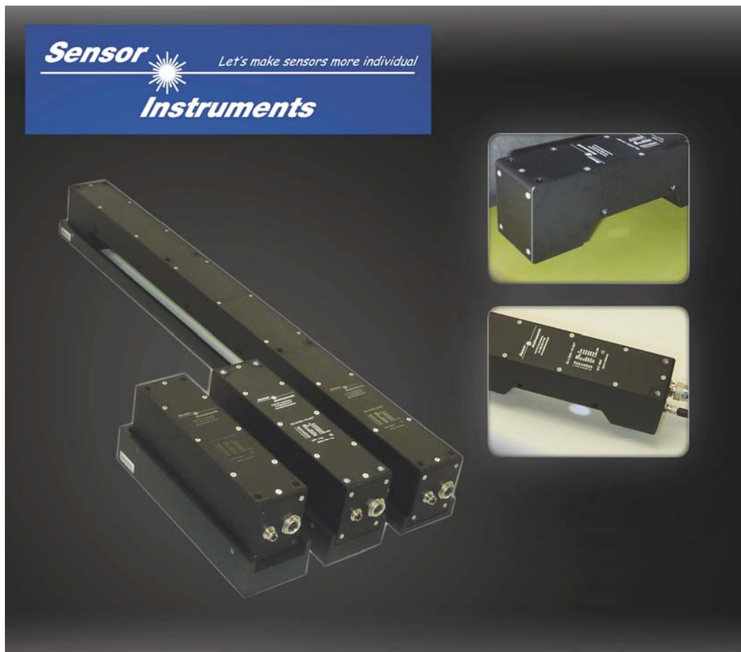
Die Sensoren der GLOSS Serie zur Inline-Glanzmessung